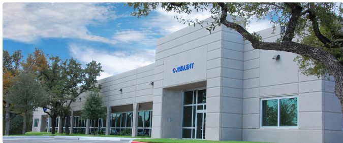
Sede da Corvalent · Cedar Park, TX — Estados Unidos

"A inteligência já está na planta. Falta o canal para extraí-la."